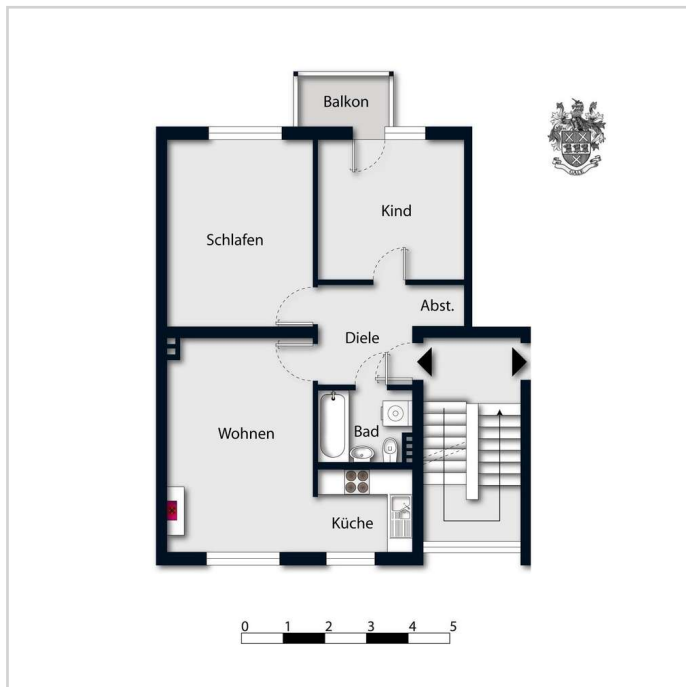
34 leer - ohne Flächenangab