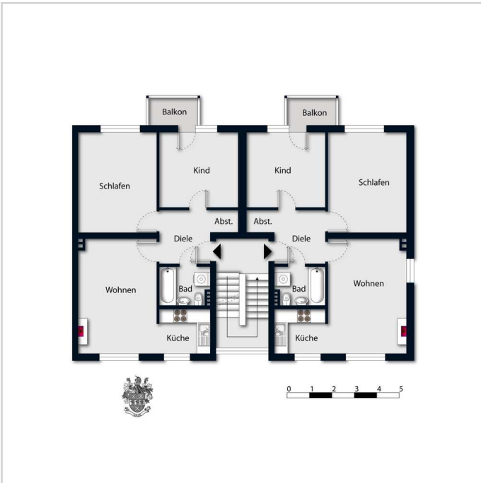
34 + 35 leer - ohne Flächena